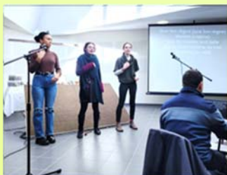
Les jeunes au culte de Noël le 18 décembre 2022 à Guilherand-Granges.