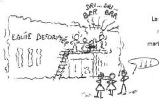
Le scellement du support pour la cloche réalisé par les pros de la paroisse : le marteau-percuteur SPIT fait des merveilles ! On en tremble encore....