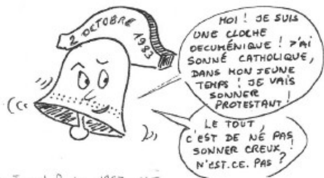
Extraits BD Journal Paroisse 1983 YLT