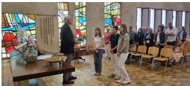
Photo : fête d'offrande du 9 juin