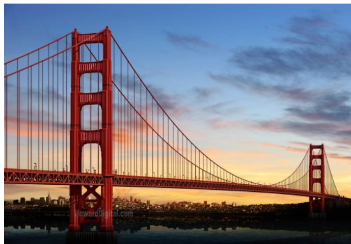
Golden Gate Bridge - San Francisco

La rencontre se terminera par un verre de l'amitié.