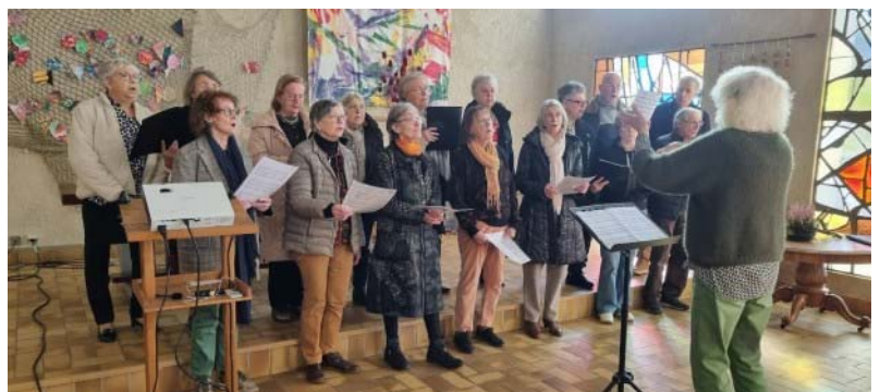
Une partie de la Chorale, culte Diaconie, 1 er février

Venez chanter avec nous dans une ambiance joyeuse et fraternelle !!!